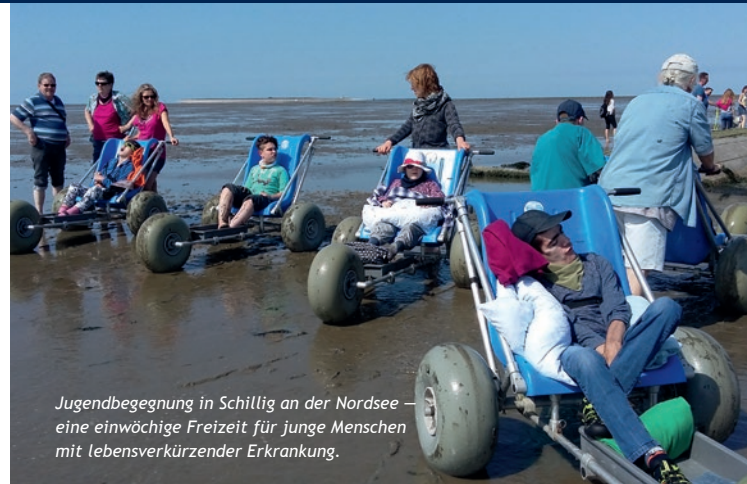
Jugendbegegnung in Schillig an der Nordsee – eine einwöchige Freizeit für junge Menschen mit lebensverkürzender Erkrankung.

* Mit dem konservativen Anlagekonzept, ebenso wird bei der Anlage auf Ethik- und Nachhaltigkeitsaspekte geachtet.