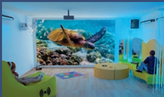
Mobiler multisensorischer Raum

Ambulante Dienste im nahen Wohnumfeld der betroffenen Familien sind eine enorme Entlastung. Kurze Wege, um den Kontakt und Angebote im Dienst nutzen zu können, sind wichtig!